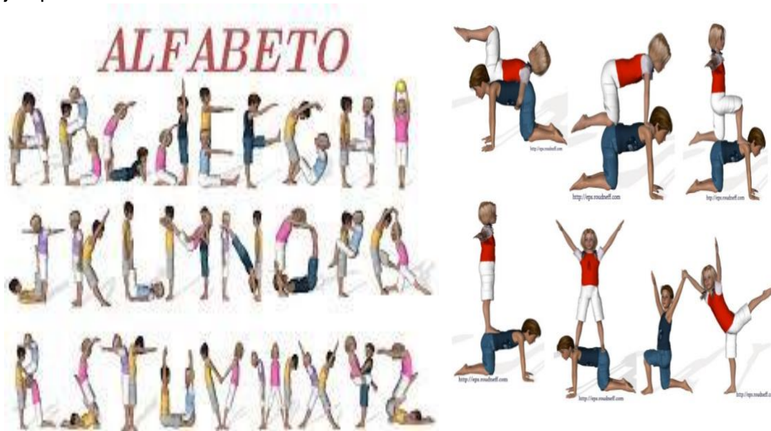
Imagen No. 1 y 2